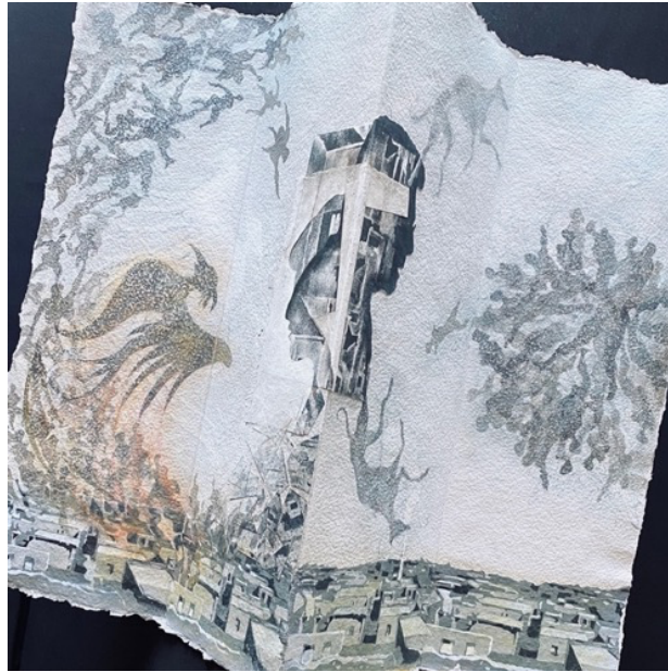
Three-fold folios in the series “ Phoenix & Mermaid in the City of the Dead ” 同作品群《死の町の不死鳥と人魚》の三つ折りのフォリオ